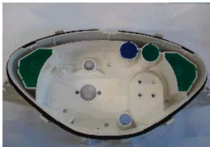
ANTES DA MODIFICAÇÃO