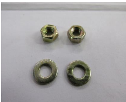
PORCA E ARRUELA M4 BICROMATIZADA