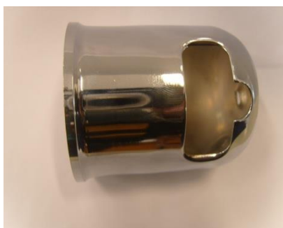
COPO CROMADO 52 mm CP-52S