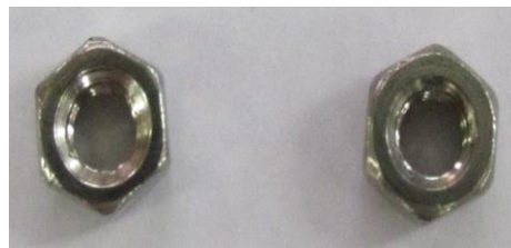
PORCA M6 INOX