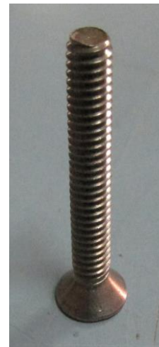
PARAFUSO CABEÇA CHATA, PHILIPS, INOX, M6x12