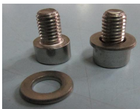
PARAFUSO ALLEN CABEÇA CILINDRICA, INOX, M6x10 E ARRUELA LISA, INOX, M6.